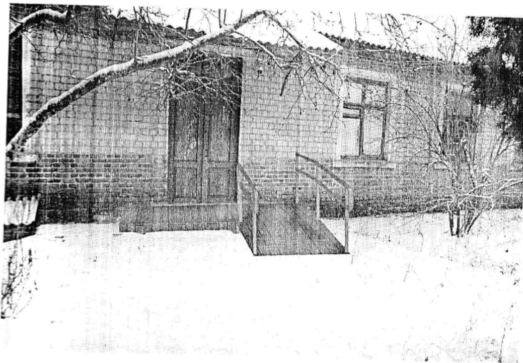
Загальний вигляд пандусу

Відповідно до програми обстеження виконані роботи з фотофіксації елементів пандусу.